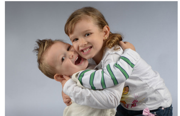
Kinder & Familien